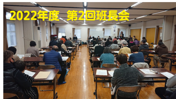
お疲れさまでした!