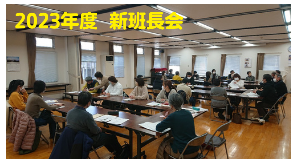
よろしくお願いします!