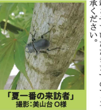
「ニヤにかご用?」