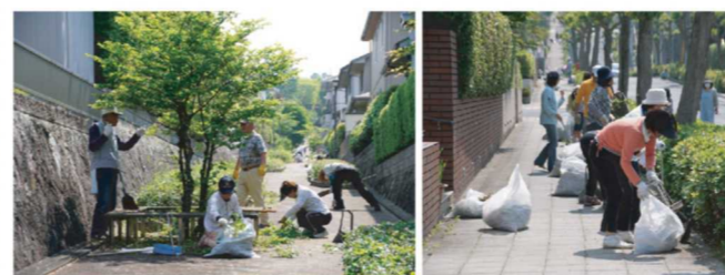
皆さんで協力してきれいになっていく北陵の街並み

短い時間でしたが、とてもきれいになりました。ありがとうございました。また、今回はお茶とジュースを用意しましたが、ジュースは特にお子様に好評でした。