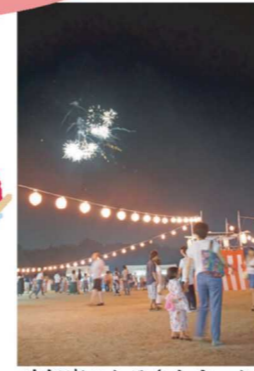
昨年度のふるさとまつり

日時:7月24日(日)18:00~ 8月28日(日)20:00~ 場所:北陵集会所集合 ※雨天中止