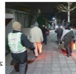
昨年度の冬季防犯パトロール

日時:8月6日(土)17:50~ *19:40 抽選締切り *20:20~打ち上げ花火 場所:多目的広場 ※小雨決行