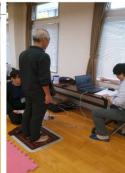
足裏・重心バランス