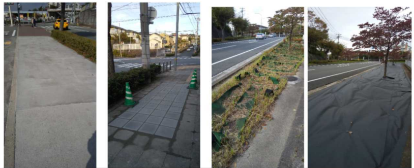
セブンイレブン前 美山幼稚園前 公民館と花咲くマンション間