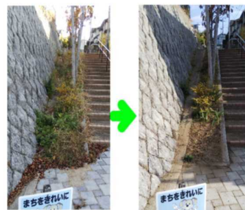
みなさまのご協力で、雑草だらけの遊歩道もきれいになりました！