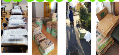
ゴミ袋とお茶・ジュースを配布するためにももって仕分け