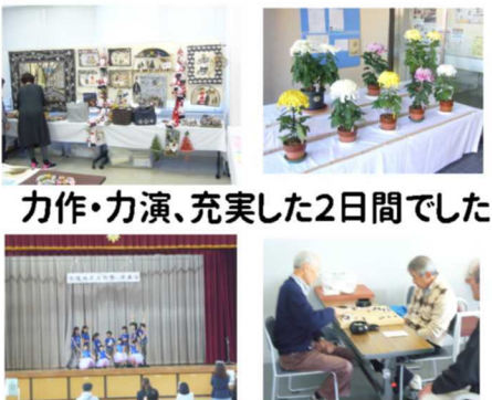
力作・力演、充実した2日間でした

11月3日・4日(土・日)に、北陵文化祭が行われました。北陵公民館では作品展・お茶席・囲碁と将棋の対局がありました。また、北陵小学校体育館ではダンスなどの発表会とグループの活動を紹介する展示がありました。